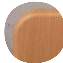
Optional mit WOODMARK®-Platte