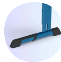
Bodenschoner schützen Tischfuß und Boden