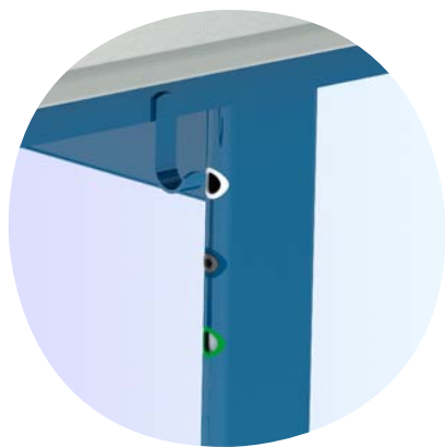
Schnelle Höheneinstellung mittels Inbusschlüssel für jede Altersklasse