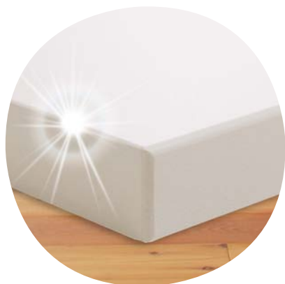
Tischplatte mit mehrlagiger Melaminharzbeschichtung und haltbarer Kunststoffkante