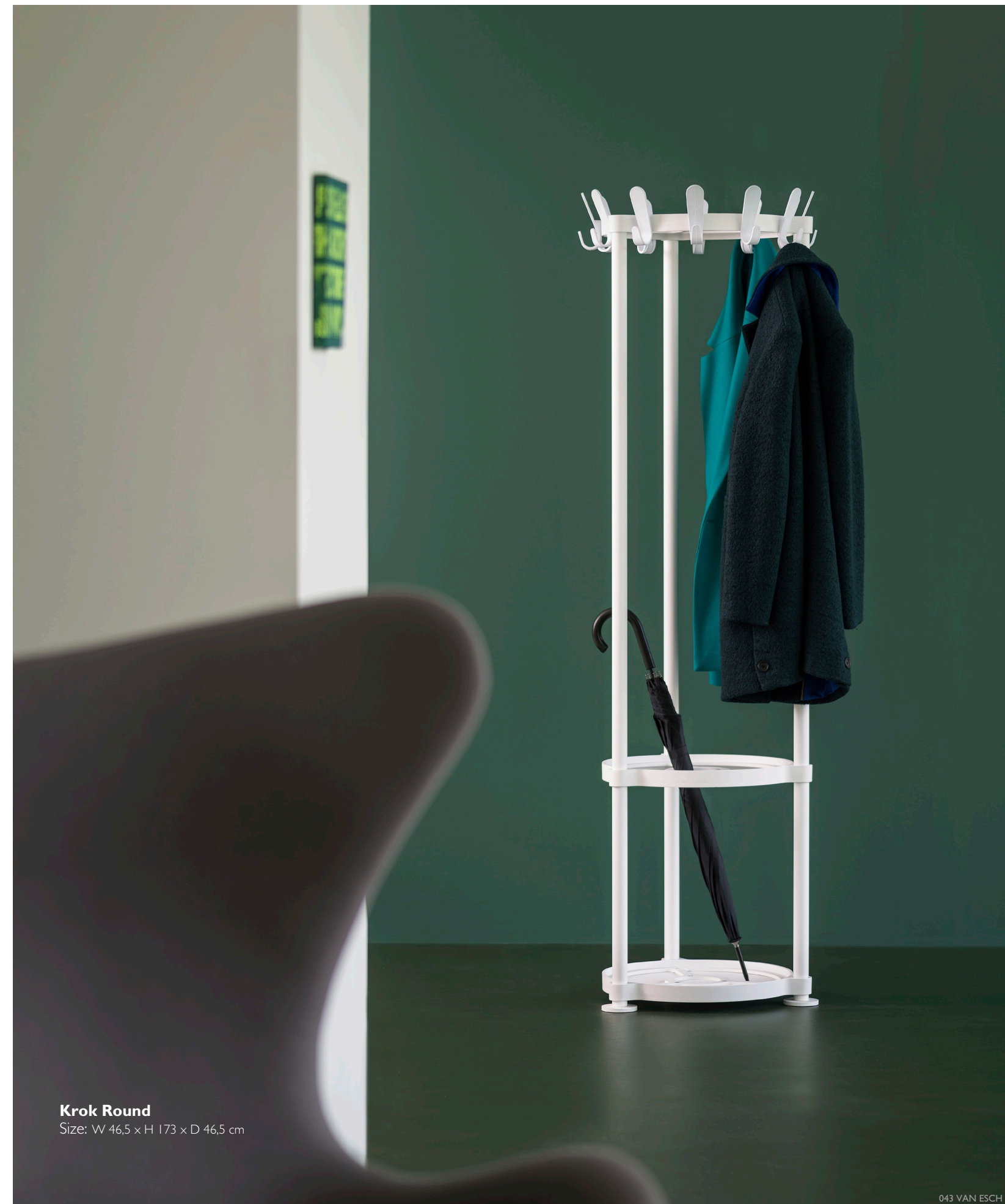
Krok Round Size: W 46,5 x H 173 x D 46,5 cm