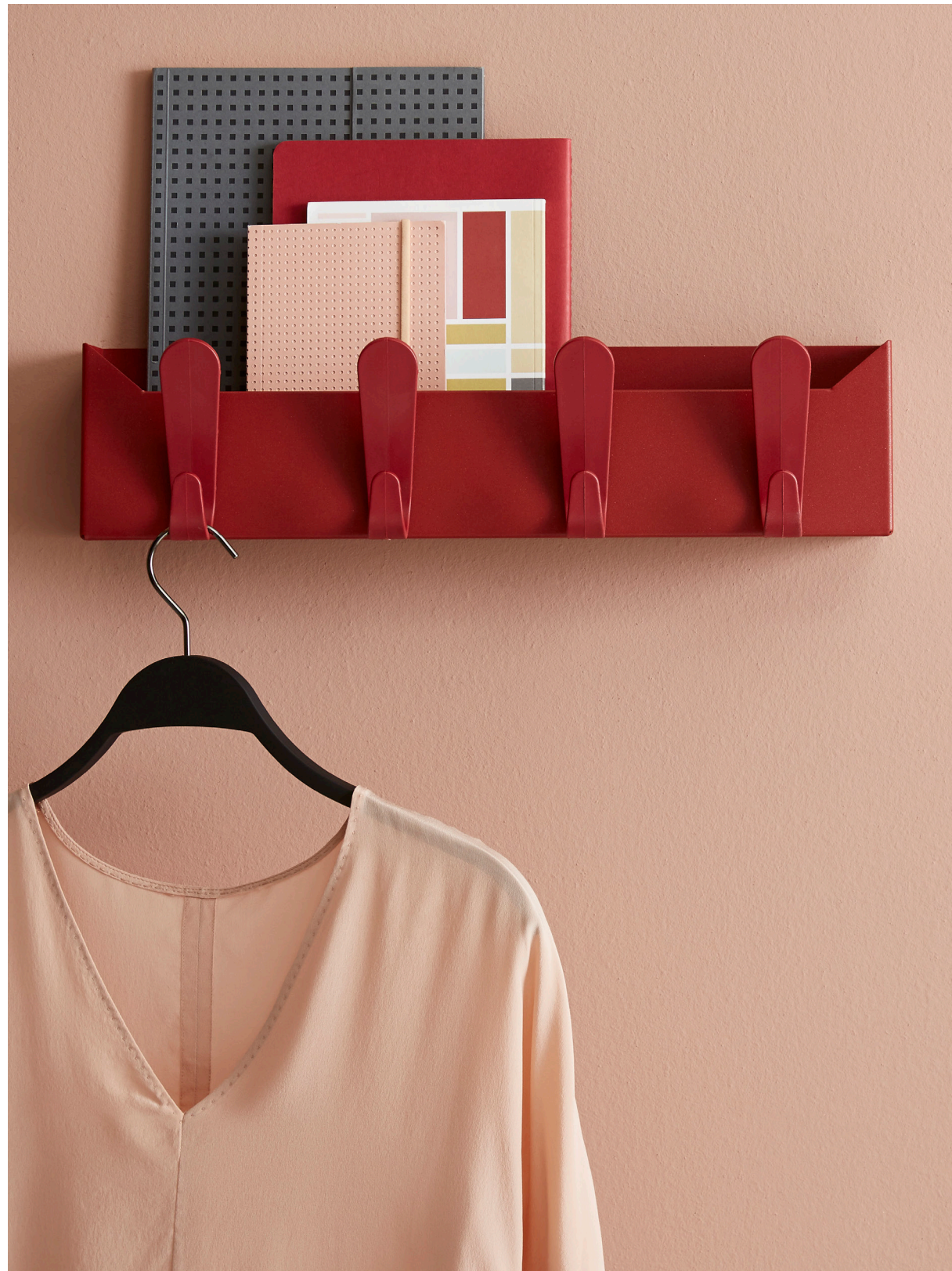
Krok Box Size: W 50 x H 12,5 x D 14,5 cm