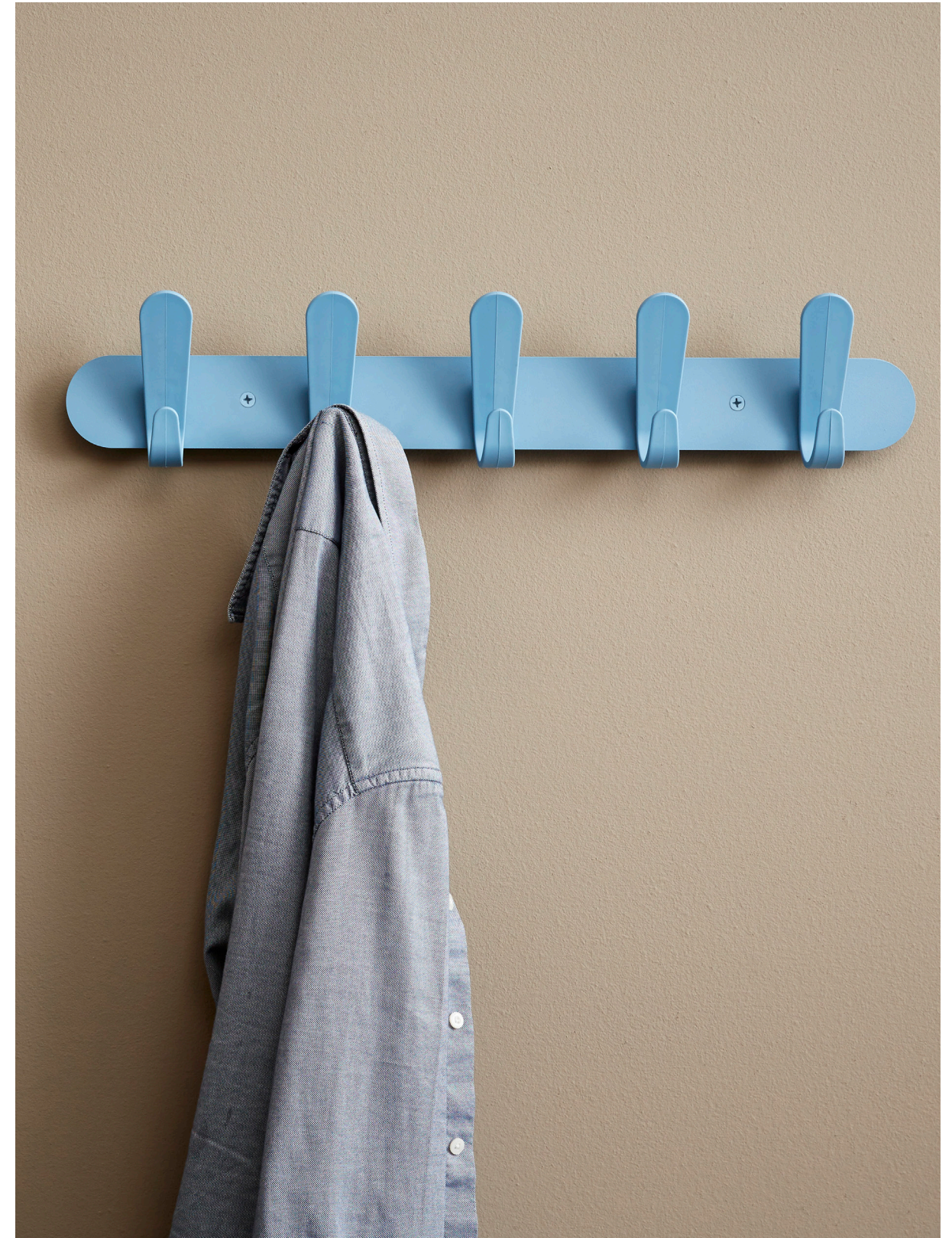
Krok HJH 60 Size: W 60 x H 12,5 x D 7,5 cm