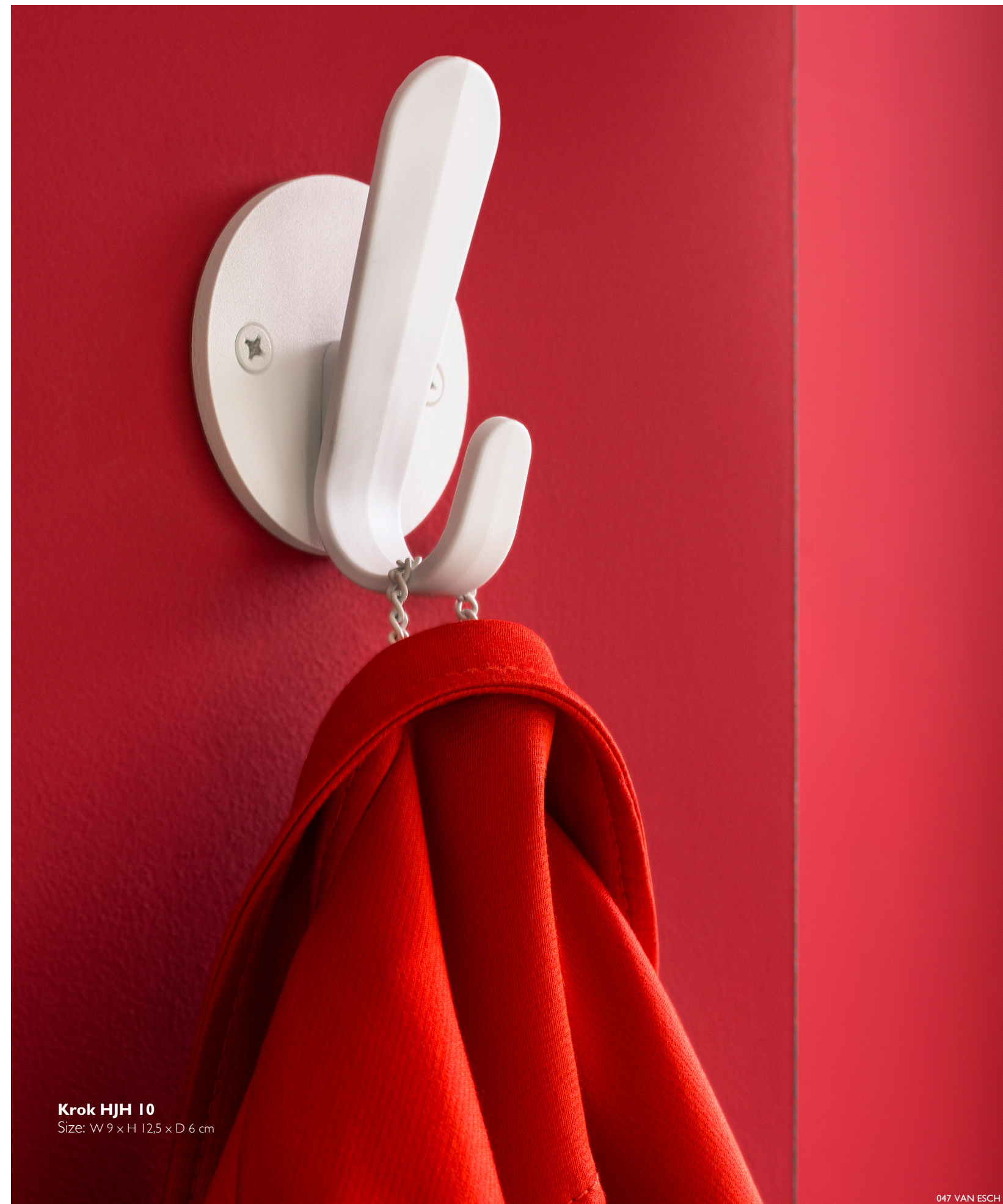
Krok HJH 10 Size: W 9 x H 12,5 x D 6 cm