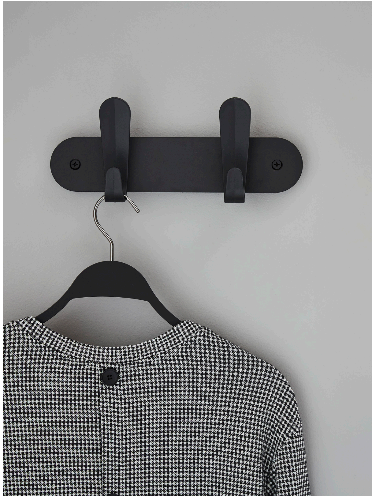
Krok HJH 30 Size: W 30 x H 12,5 x D 7,5 cm